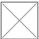
Figuur 1: Simpel ER-diagram zonder kardinaliteit

Binnen een ER-diagram, kunnen we Tabel 2 als volgt tekenen: